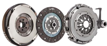
Valeo FullPack DVA™

Valeo Service Benelux B.V, Mai 2018- Avec une importante extension de gamme de sa double offre DVA, Valeo propose dès maintenant une double offre compétitive composée de plus de 110 Valeo FullPACK DVA™ (Double Volant Amortisseur et kit d'embrayage d'origine), 250 Doubles Volants Amortisseurs et 180 Valeo Kit4P™ (kits de conversion avec volant moteur rigide) couvrant près de 70 % du parc automobile européen équipé de DVA. Valeo confirme donc sa position de spécialiste du Double Volant Amortisseur sur le marché , offrant une solution adaptée aux besoins de chaque client.